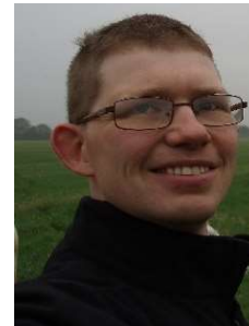
Claus Østergaard Bitsch Astrid og Frederik på Månen Valgt frem til 2021